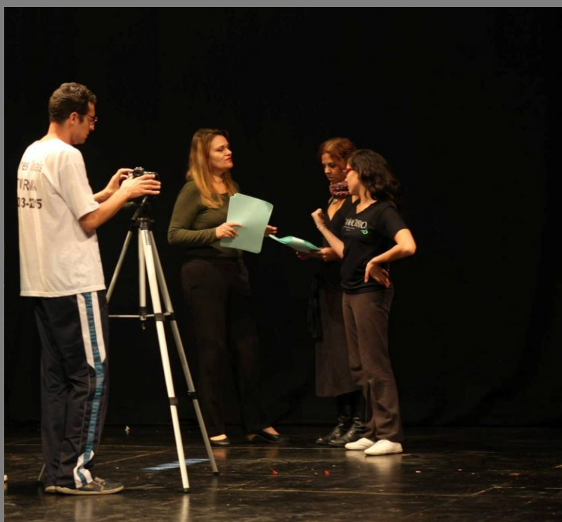
Ensaio da Série Digital “Avulsos”

Este e-book não tem como objetivo se aprofundar em técnicas de desenvolvimento de um “Roteiro”, e, sim, incentivar você a escrever e produzir a sua própria websérie, através de dicas e alguns conceitos.